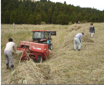
・集草手払い / 池の窪牧野

日程や募集方法、参加費の設定、受け入れ体制など様々な課題はあるものの、参加者からは「いい経験になった」「阿蘇の草原のことがわかってよかった」など、組合側からは「思ったよりよく働いてくれて助かった」「来年も来て欲しい」などの意見が寄せられ、維持活動支援ツアーへのニーズはあるということが確認されました。