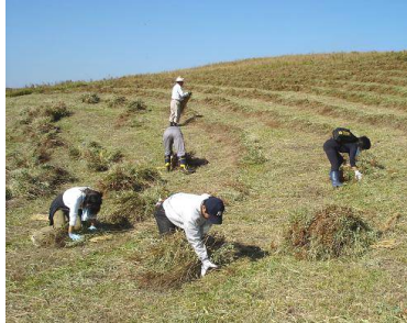
・結束・集草作業 / 木落牧野