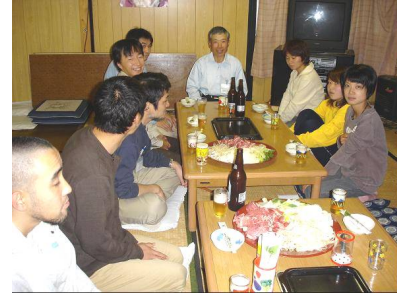
・作業後の交流会 / 町古閑牧野